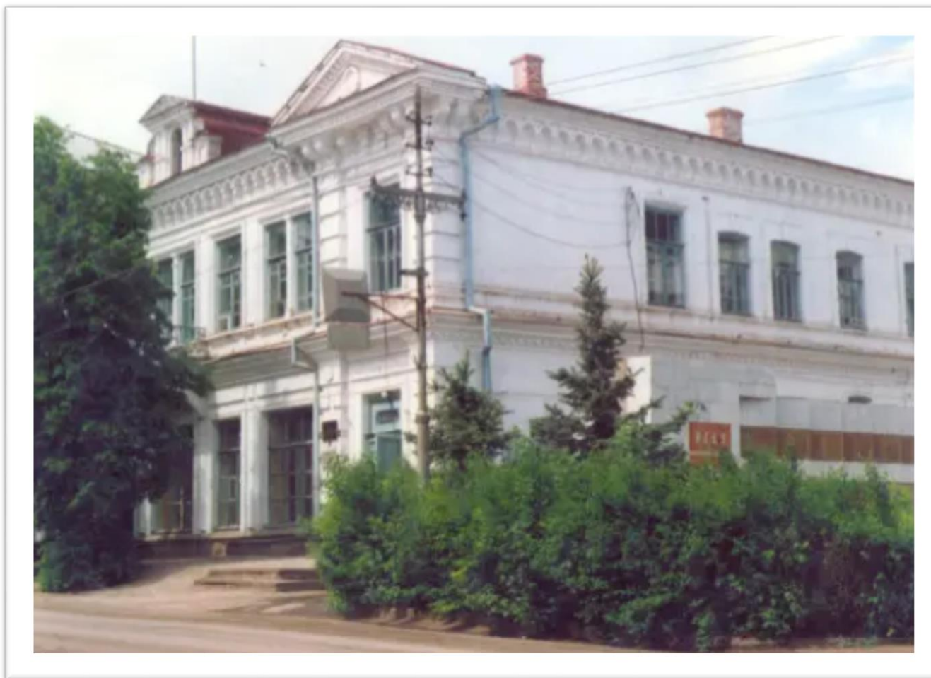
Дом купца Фадеева