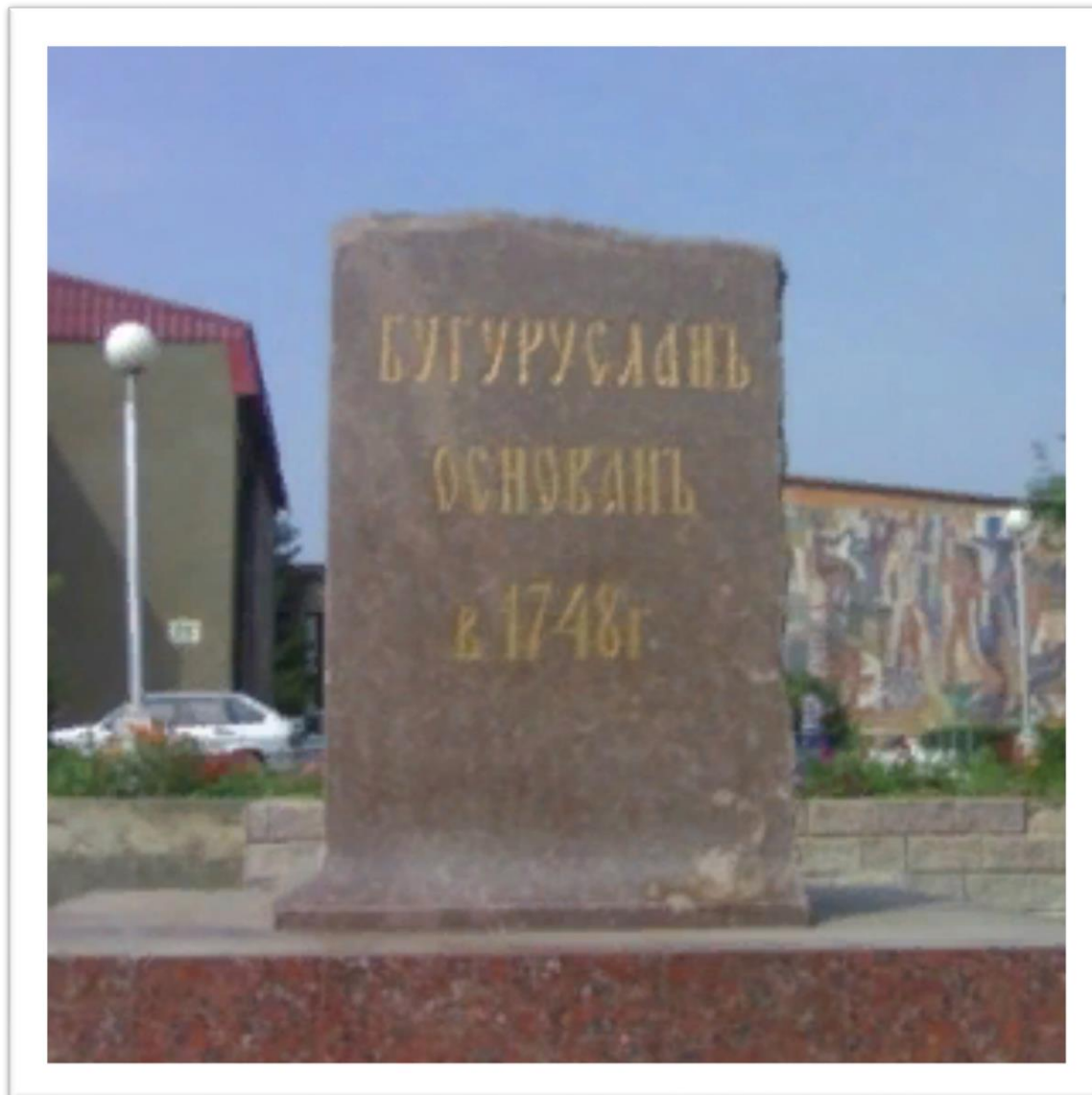
Памятный знак - Основание Бугуруслана