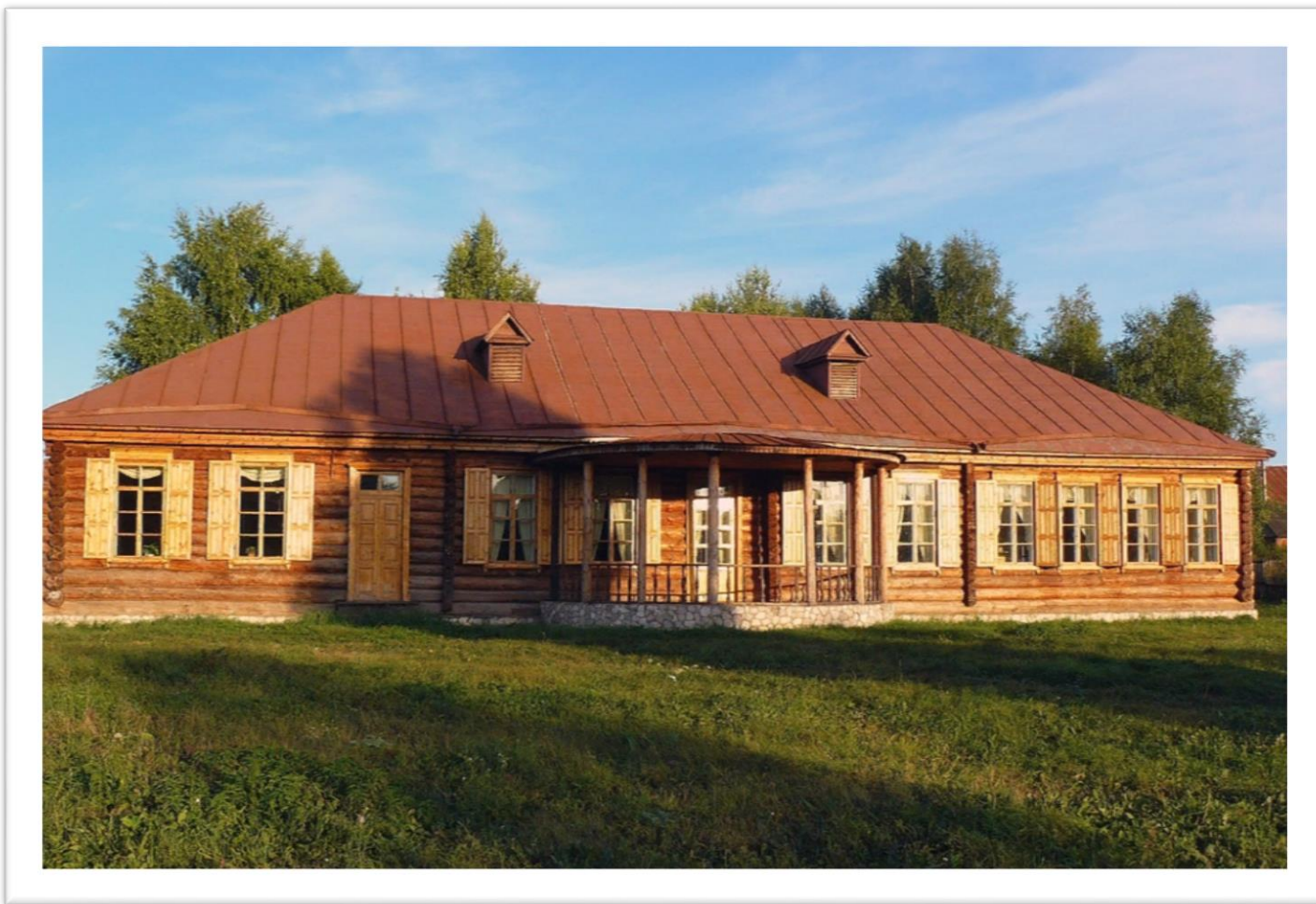
Родовое гнездо оренбургского писателя С.Т. Аксаково в селе Аксаково