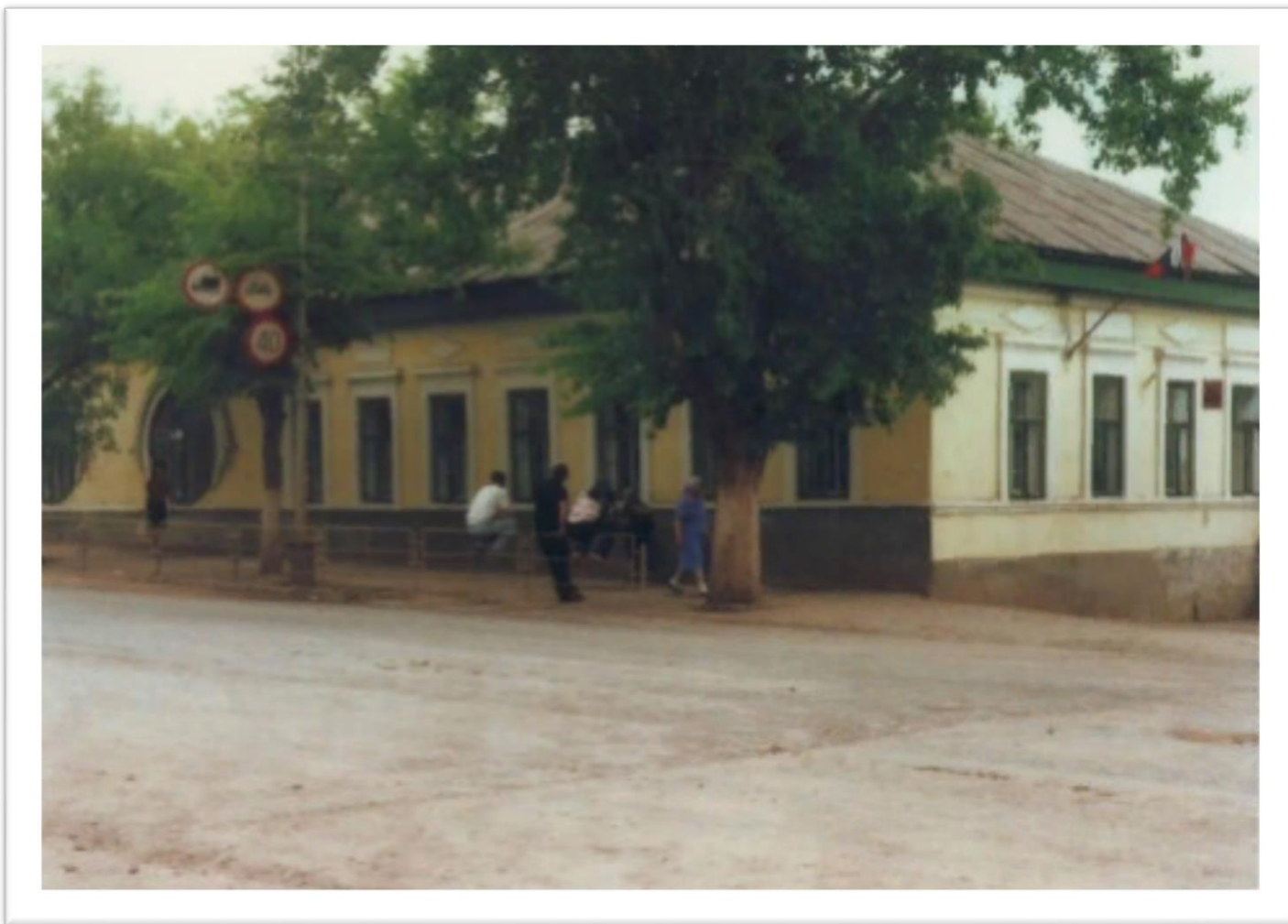
Дом дворянина Рычкова