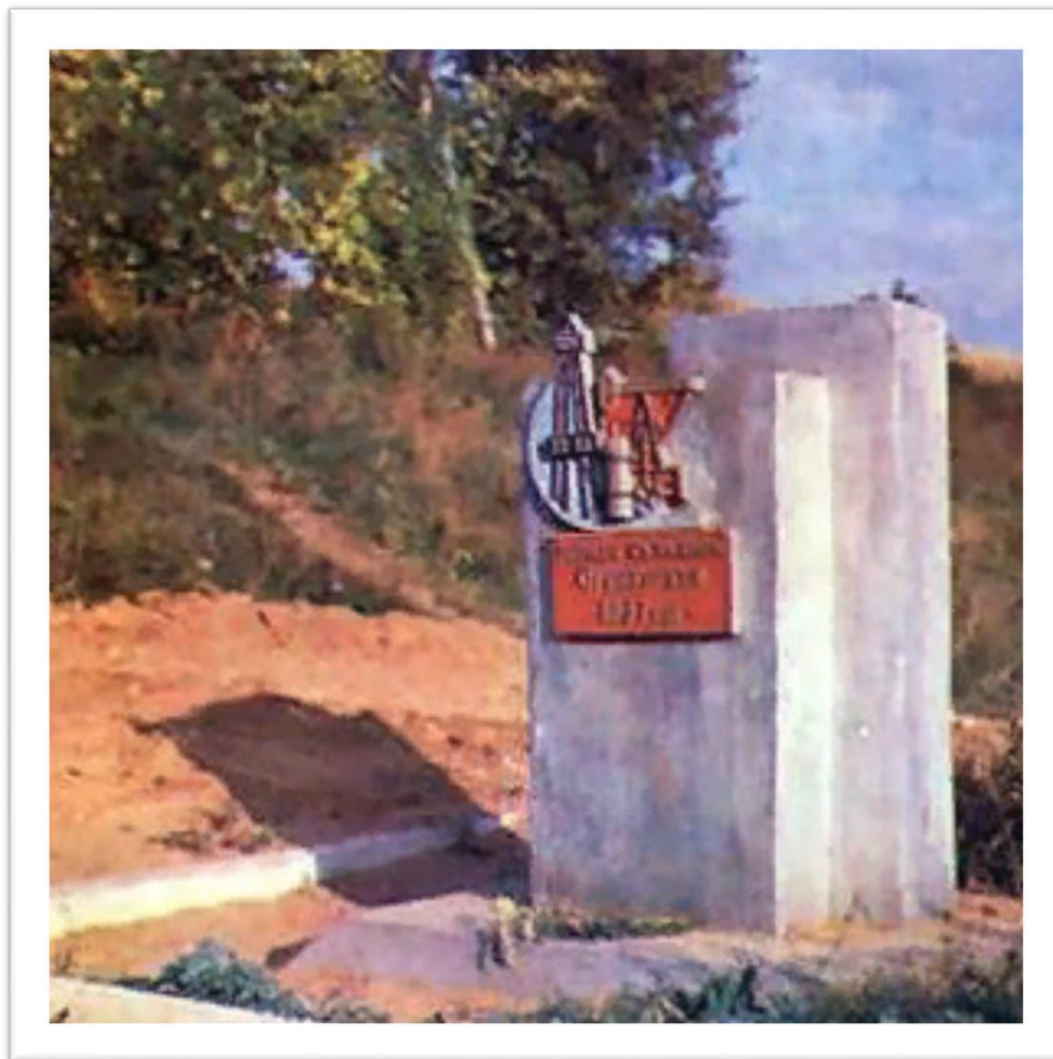
Памятник Скважина №1